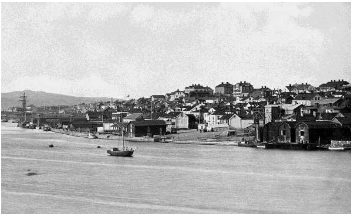
Härnösand på fotografi från 1870.