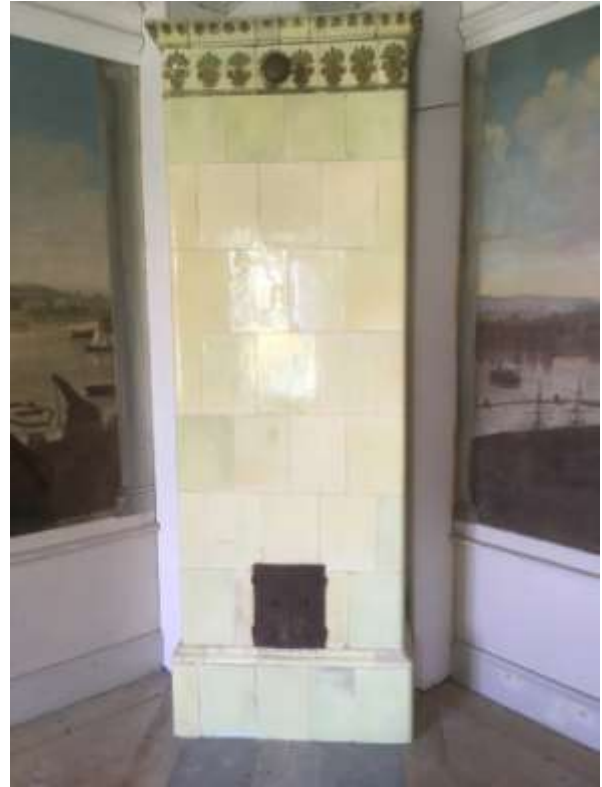
Ytterligare några av de kakelugnar som finns i byggnaderna vid Murberget i Härnösand. Den nedre är uppsatt i Prästgården och de två andra vid Åvike herrgård.