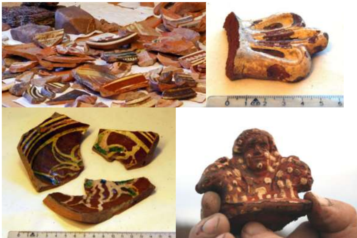
De keramikskärvor som hittades på platsen finns i förvar hos Länsmuseet i Härnösand, och här visas, efter tillstånd från museet, några bilder på en del av denna keramik. Ytterligare bilder finns längre fram i dokumentationen.

I de handlingar som varit tillgängliga, det vill säga mantalslängder, har det tyvärr inte gått att träffa på någon krukmakare i området, men detta möjligtvis beroende på undertecknads bristande förmåga att tyda den inte alltför välskrivna texten. Personen kan ju även ha varit skattskriften (mantalsskriven) i en annan socken än Skön.