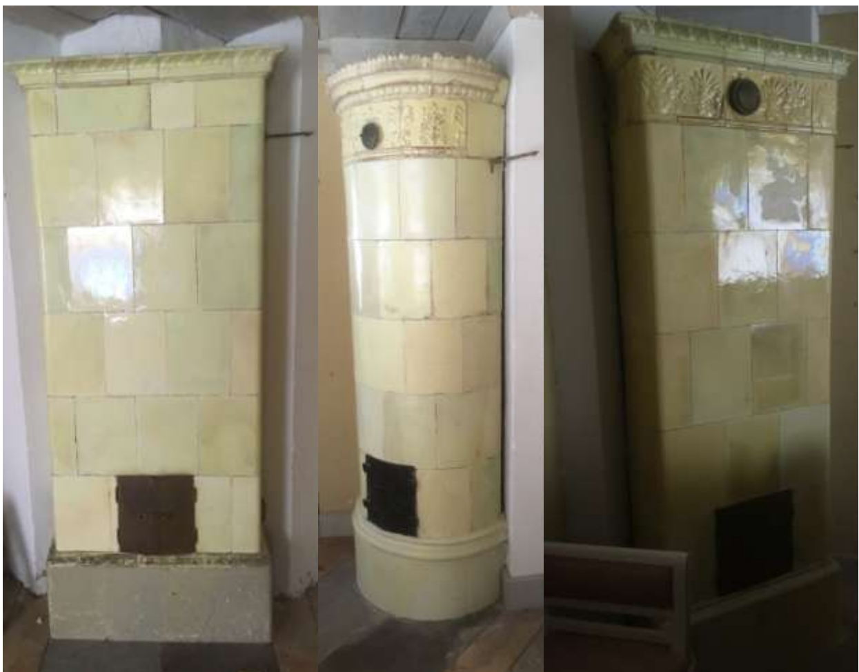
Ovanstående kakelugnar, vilka numera finns uppsatta vid Åvike herrgård, kan mycket väl ha blivit tillverkade av någon kakelugnsmakare i Härnösands-området, eller möjligtvis av någon som var verksam något längre upp i Ångermanland.