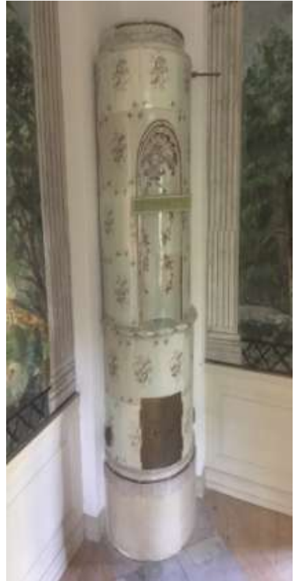
Dessa tre 1700-tals ugnar, vilka finns uppsatta vid Åvike herrgård, har tidigare varit placerade vid Vallrothska gården i Ålandsbro. Möjligtvis kan de ha blivit tillverkade av en mästare från Härnösand.