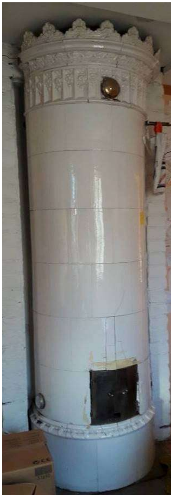
I ett Härnösands-hus från omkring 1860 finns fem kakelugnar, varav två visas på nedanstående bilder. Kakelugnarna kanske inte är riktigt lika gamla som huset, men troligtvis från dess första tid. Möjligen kan de ha blivit tillverkade i Härnösand.